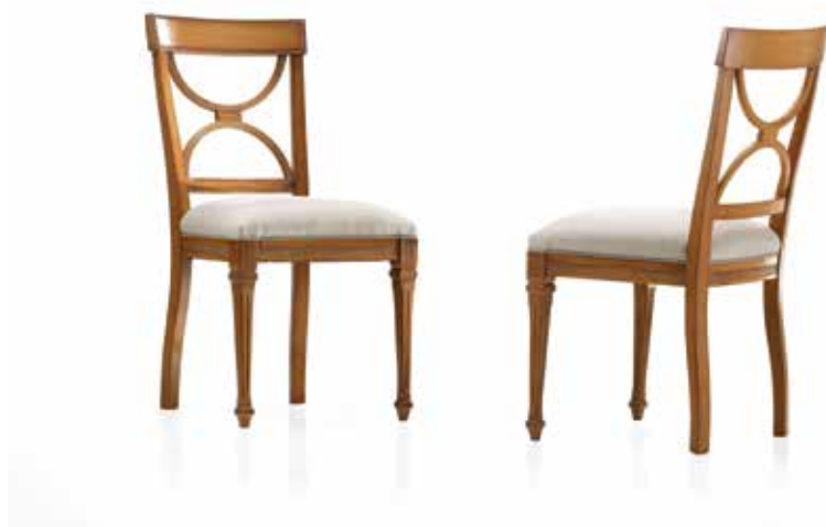
Chair art. 141/S