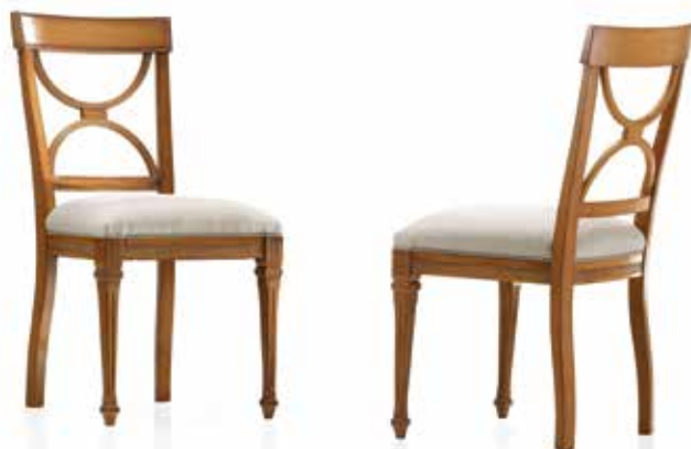
Sedia art. 141/S