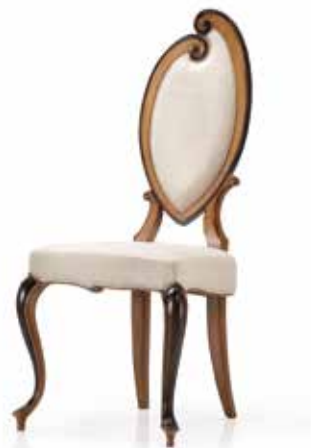
Sedia art. 191/S