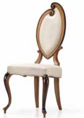
Chair art. 191/S