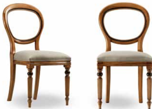
Sedia art. 142/S