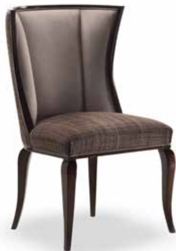
Sedia art. 255/S