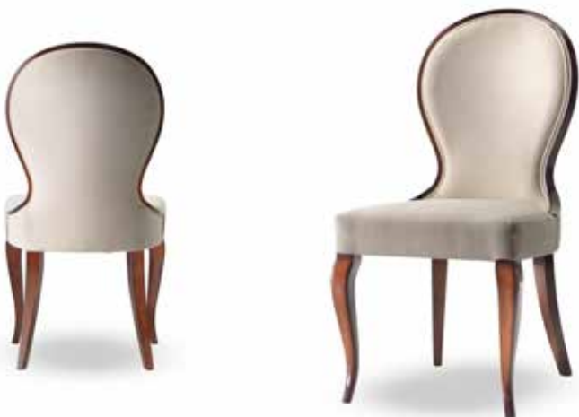
Sedia art. 217/S