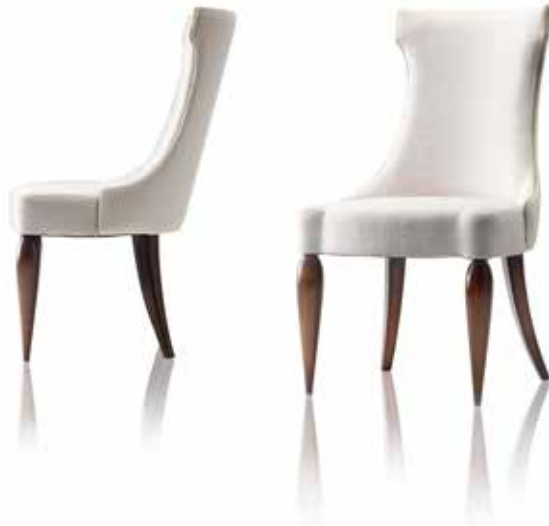
Chair art. 232/S