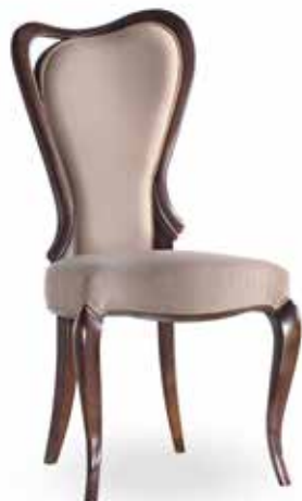
Sedia art. 213/S