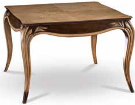
Table art. 706/T