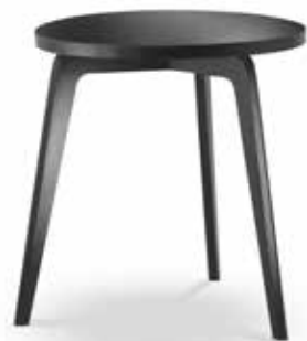
Table art. 803/T