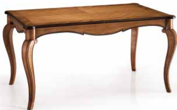
Table art. 711/T