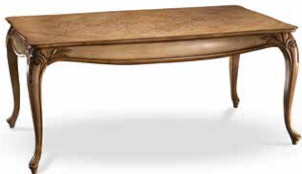
Table art. 706/T - extendable