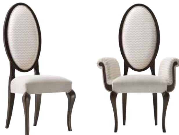
Sedia art. 170/S