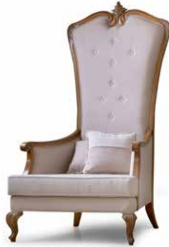
Armchair art. 476/P