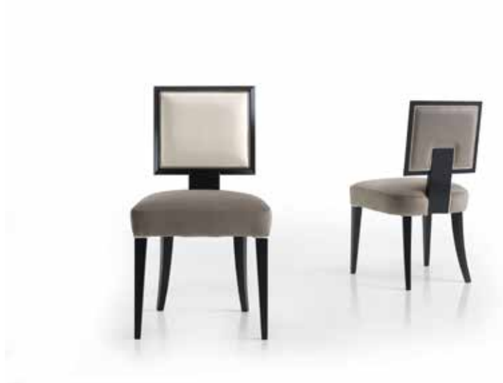
Chair art. 246/S