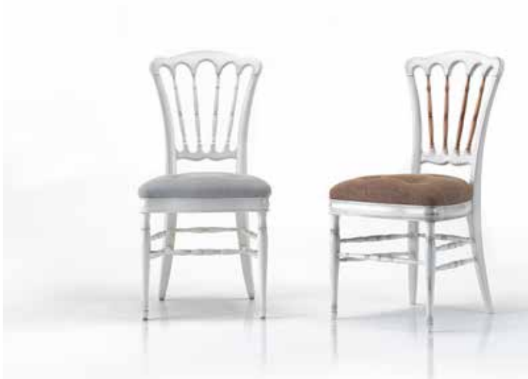
Chair art. 220/S