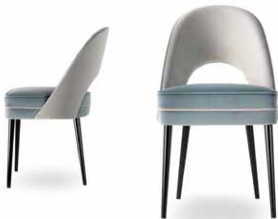
Sedia art. 210/S